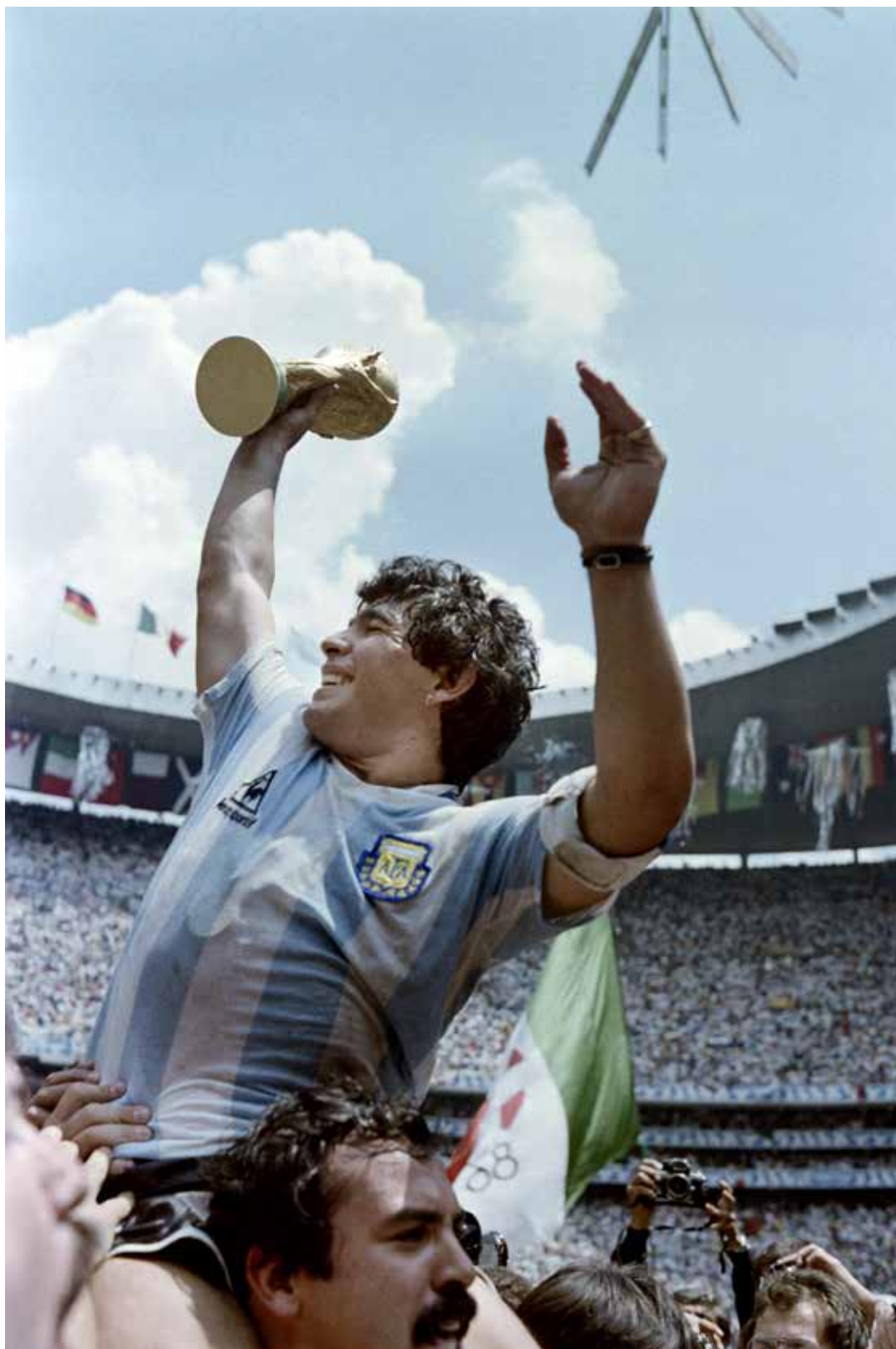
29 juin 1986 – Le capitaine de l'équipe de football argentine, Diego Maradona, brandit la Coupe du monde de football remportée par son équipe après une victoire 3-2 sur l'Allemagne de l'Ouest au stade Azteca, à Mexico.