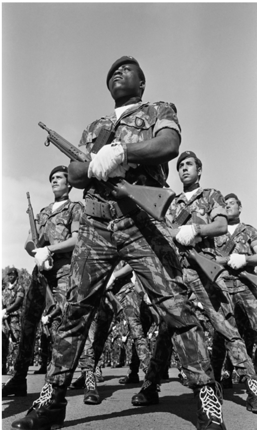
27 juillet 1973 - Forces spéciales de l'armée portugaise s'entraînant au camp militaire de Dondo à Maputo (anciennement Lourenço Marques) pendant la guerre d'indépendance du Mozambique.