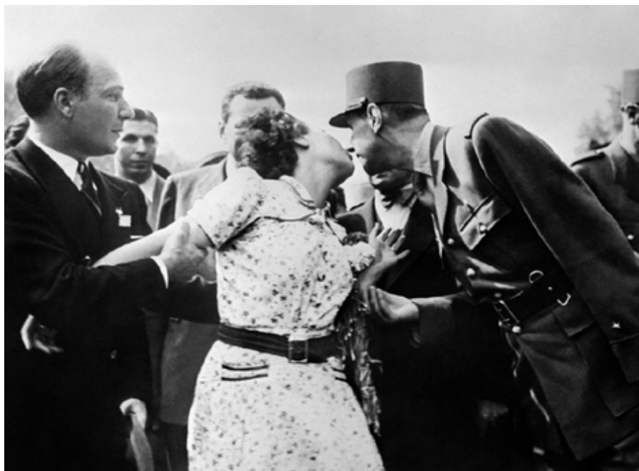
26 août 1944 - Une Parisienne manifeste sa joie en embrassant le général De Gaulle, sur les Champs-Élysées, lors du défilé après la Libération de la capitale.