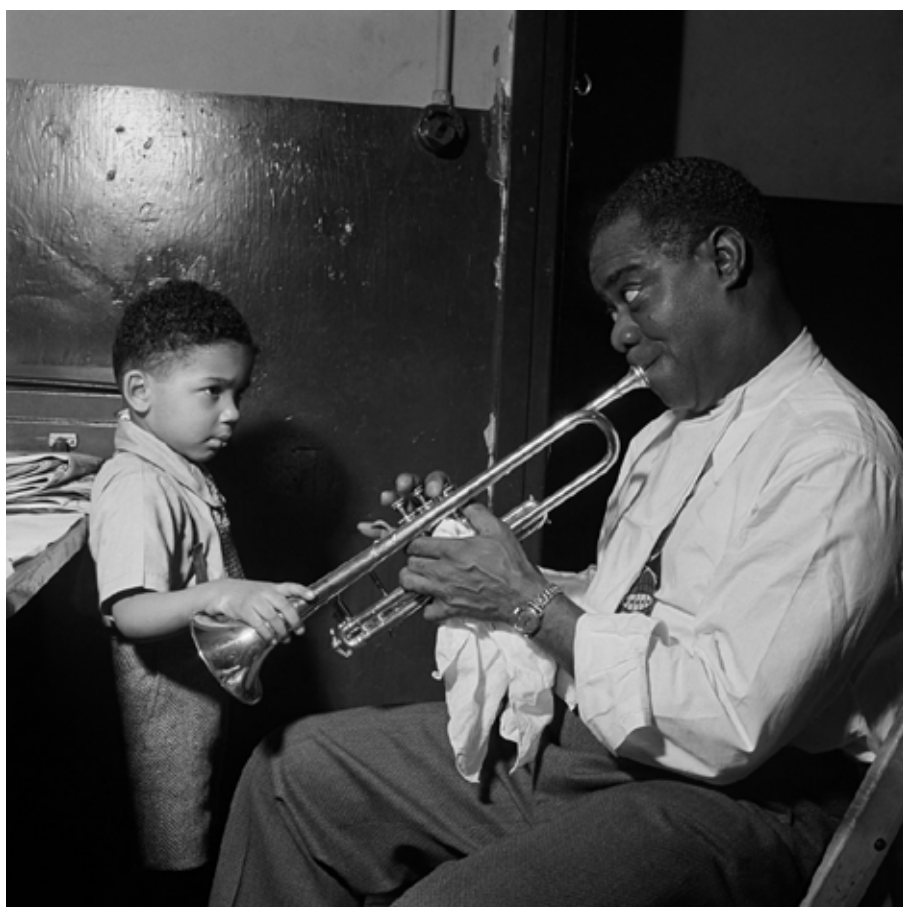
1947 - Louis Armstrong joue de la trompette pour un petit garçon dans sa loge, avant un spectacle dans un cabaret de jazz de New York.