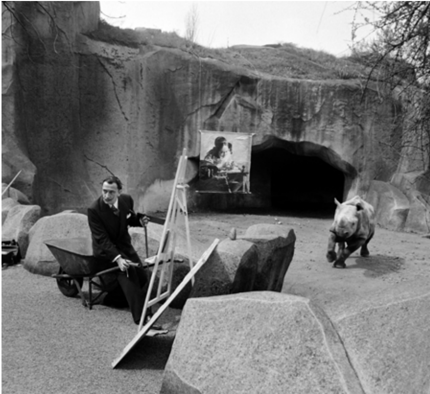
30 avril 1955 - Salvador Dali peint un rhinocéros avec le célèbre tableau de Vermeer « La Dentellière », au zoo de Vincennes.