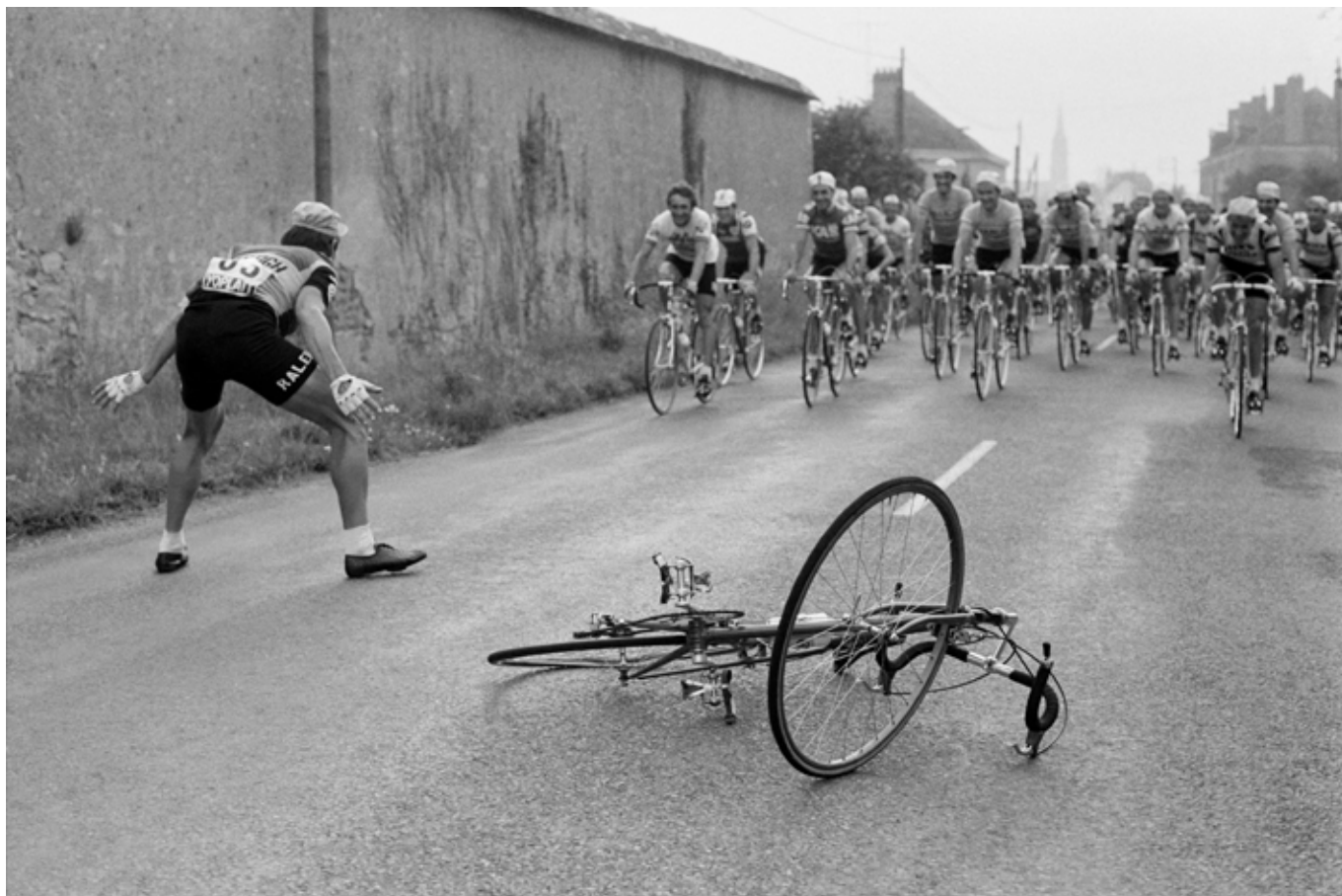
10 juillet 1977 – Le cycliste néerlandais Gerben Karstens devant le peloton, lors de la 8 e étape du 64 e Tour de France, entre Angers et Lorient.