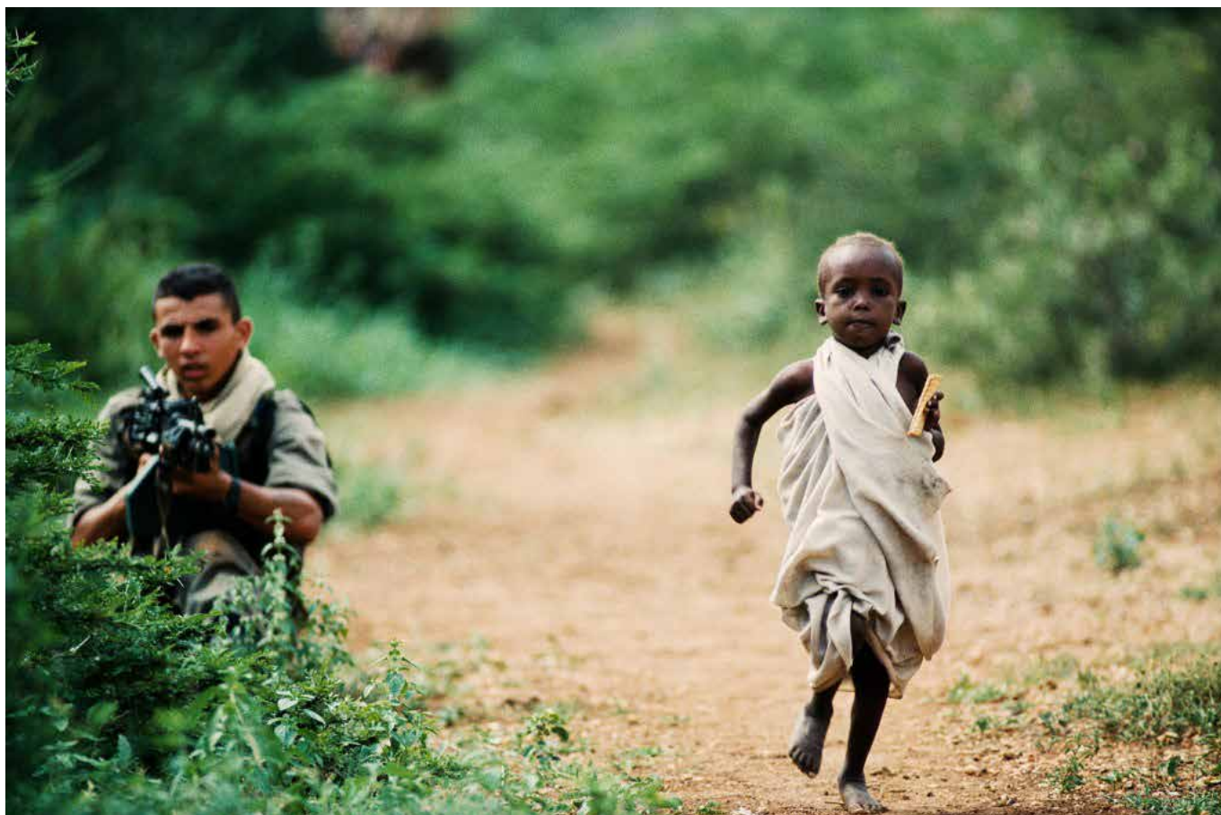
17 décembre 1992 – Un enfant somalien court vers un convoi humanitaire alors qu'un légionnaire français assure la sécurité du transport des vivres, à Baidoa en Somalie.