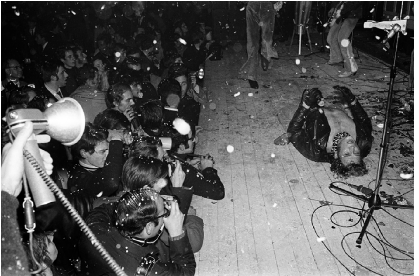
15 novembre 1967 – Johnny Hallyday sur la scène du Palais des Sports devant 6 000 spectateurs, à Paris.