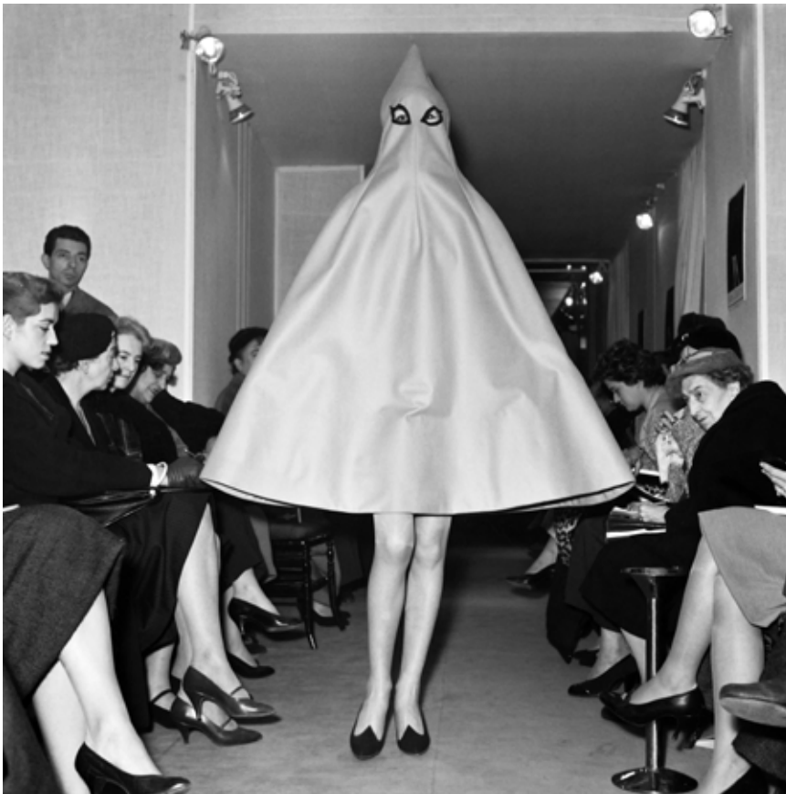
11 novembre 1957 - Un mannequin lors d'un défilé de la collection Jeanne Lanvin-Castillo, à Paris.