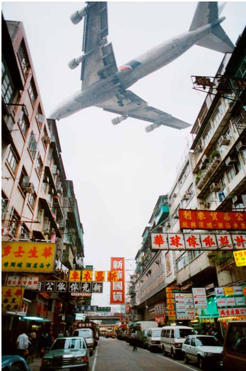
06 avril 1988 – Un avion de ligne devant les immeubles d'habitation vétustes d'un quartier de Hong Kong.