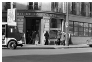
31 janvier 1974 - Des malfaiteurs sortent de la banque « Le Crédit de La Bourse » après un braquage avec des otages, à Paris.