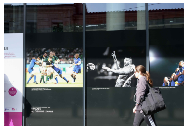
Gare de Bordeaux Saint-Jean