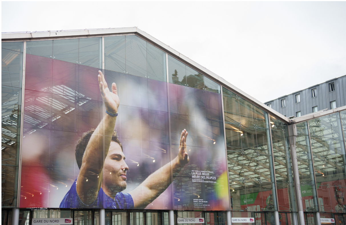
Paris Gare du Nord